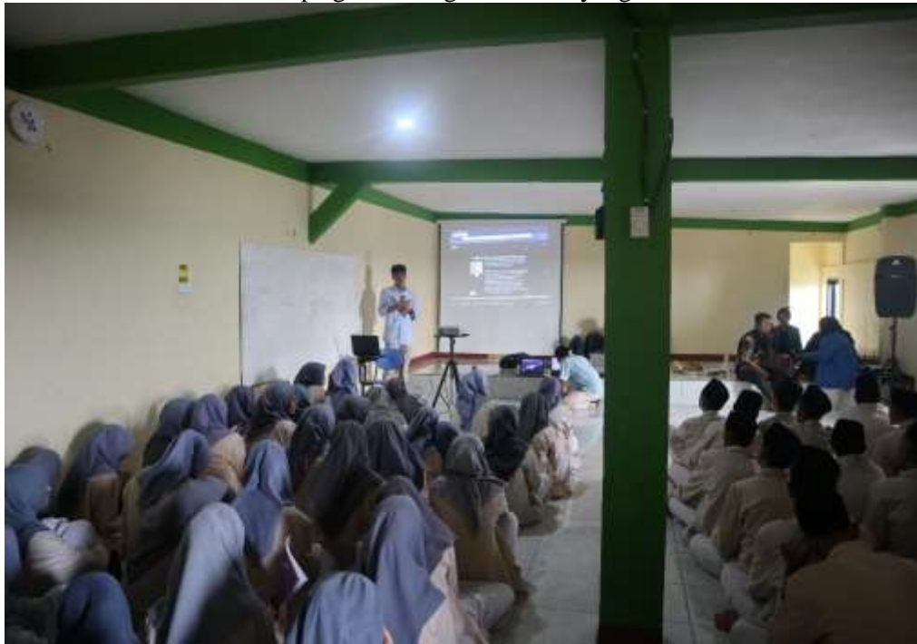
Gbr 2. Pemaparan Materi Google Keyword Planner

Berikut ini dokumentasi beberapa gambar kegiatan PKM yang dilakukan: