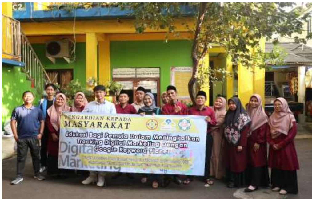
Gbr 2. Foto bersama Guru